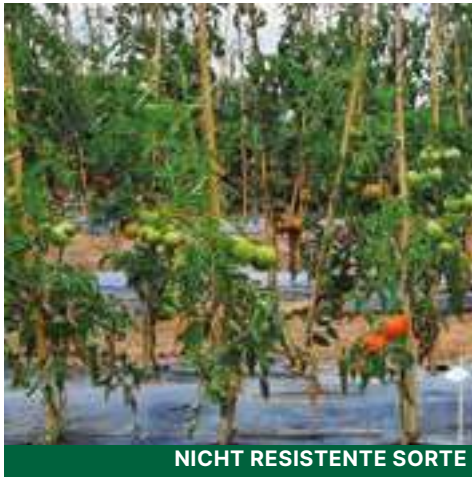
NICHT RESISTENTE SORTE