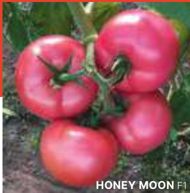
HONEY MOON F1