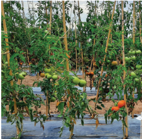
TÉMOIN NON RÉSISTANT